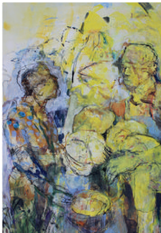
Irmgard Pricker: Die Speisung des Volkes am See Tiberias

regen, die Bibel auch im Alltag zu lesen, sie als Inspirationsquelle für das eigene Leben neu zu entdecken und mit anderen darüber ins Gespräch zu kommen.