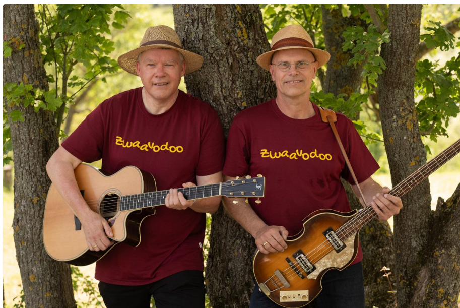
Dschubbi und Jerry = "Zwaavodoo"

Wer am 25.12. die Liedermacherweihnacht mitgefeiert hat, hat den einen schon live und in Farbe gesehen.